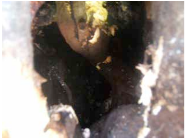
Figuur 10: Binnenzijde holte