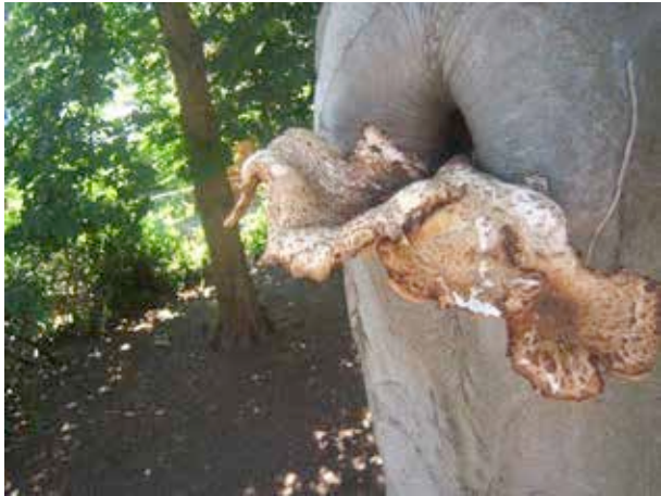
Figuur 7: Zwamaantasting