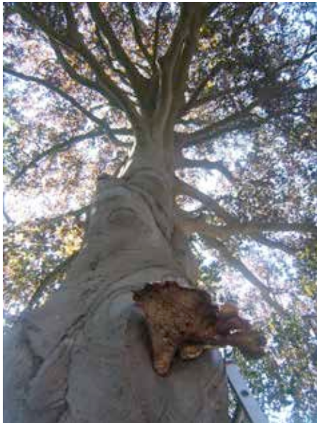
Figuur 2: Aanzicht stam met zadelzwam

Bij de boom is een nader technisch onderzoek uitgevoerd. Met behulp van prikstok is gemeten hoe diep de inrotting is, dit blijkt horizontaal 50 cm te zijn, verticaal meer dan 40 cm omhoog en 60 cm naar beneden (onder de zichtbare holte). De minimaal benodigde restwand is 18 cm.