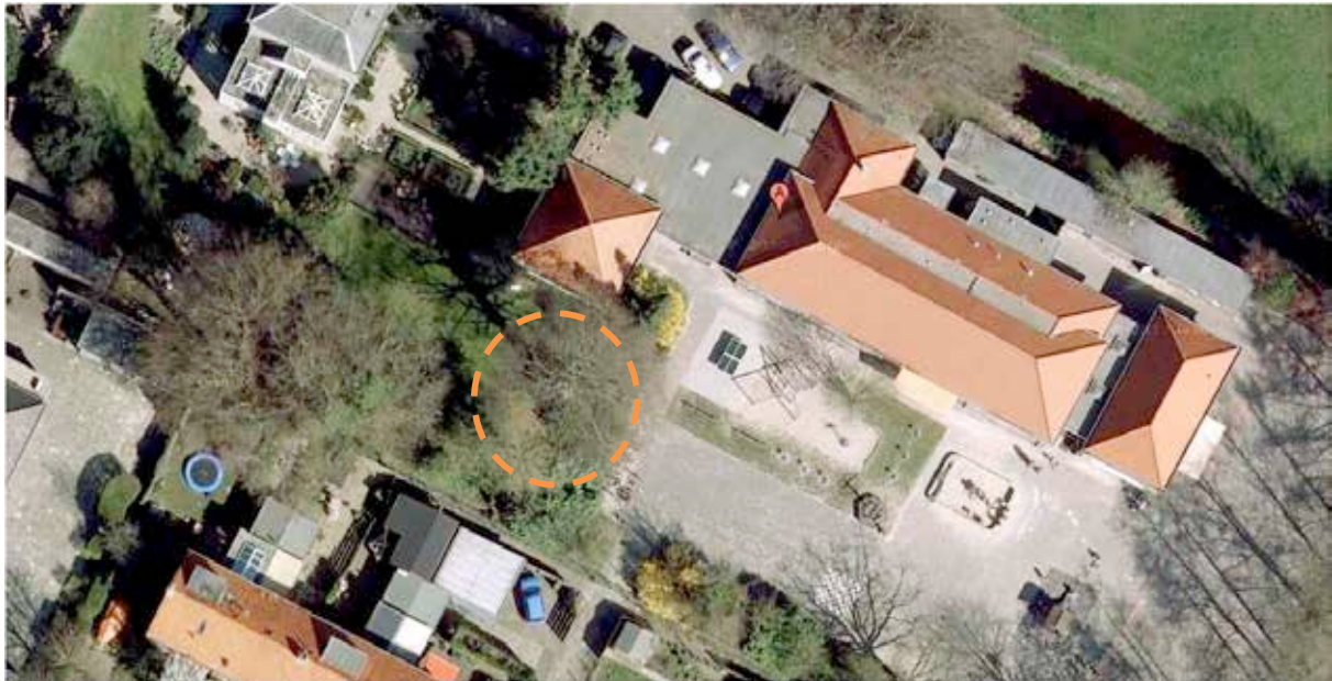
Figuur 1 Luchtfoto met de locatie van de beuk

Op de onderstaande luchtfoto is de standplaats van de boom aangegeven met een oranje cirkel.