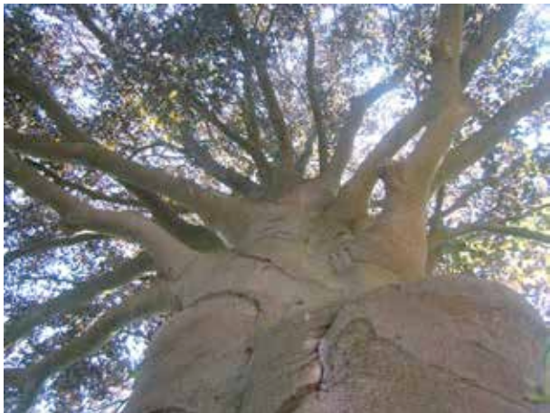
Figuur 9: Ijle kroon