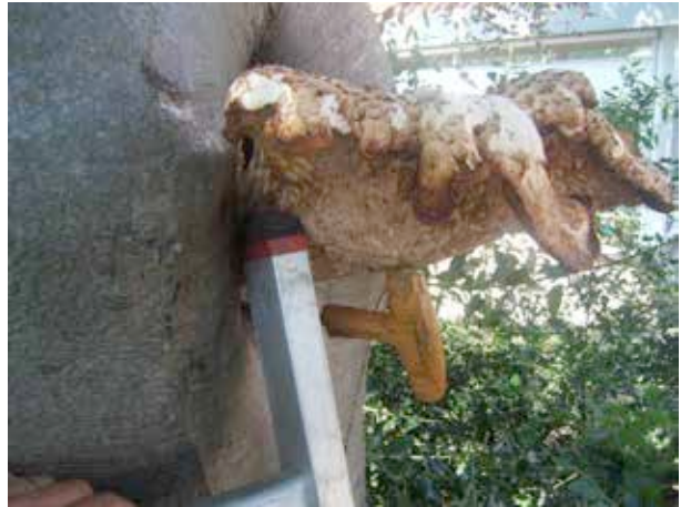
Figuur 8: Prikstok verdwijnt geheel in holte.