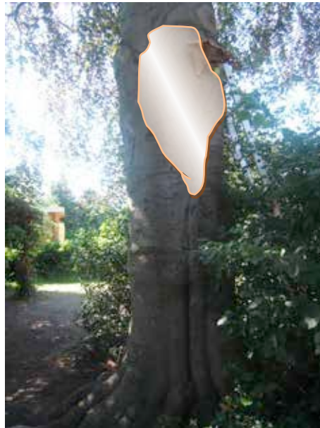
Figuur 3: Globale inrotting (gearceerd).